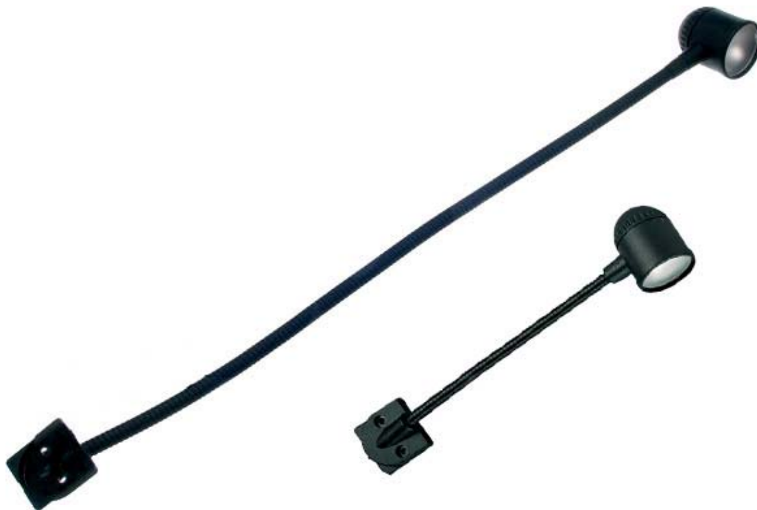
Рисунок 1 Общий внешний вид устройства