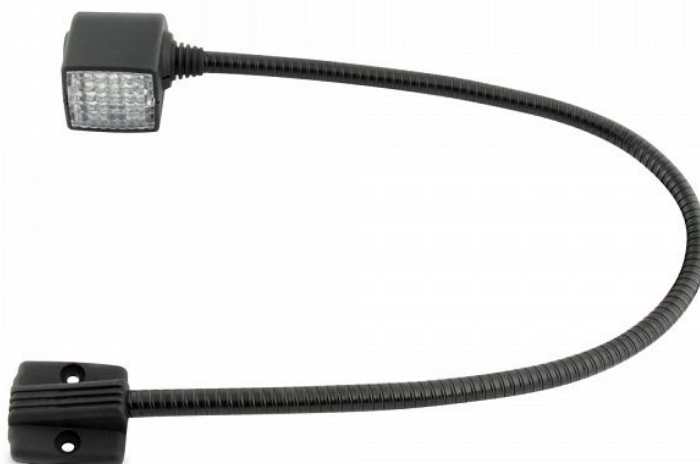
Рисунок 1 Внешний вид устройства